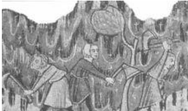
그림 6 개간사업 수사들 14세기 시본 삽화

수도사들의 대개간 사업 : 1050년 시작 1150년 정점을 이루고 1300년 중단