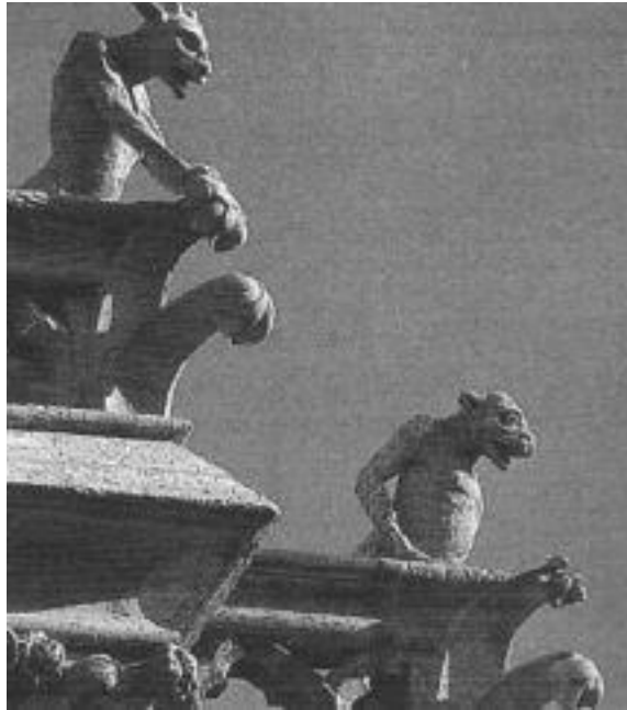
그림 8 노트르담 가고일