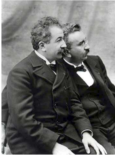
1928 모리스 라벨 <볼레로>