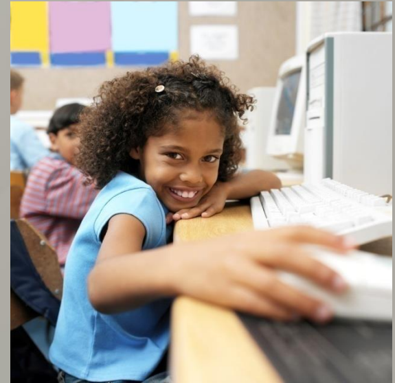
École Primaire 초등학교

Think different. Think Different has a lot of messages for me.