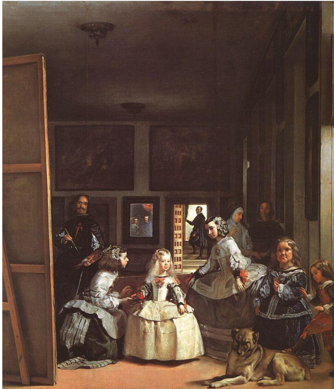
벨라스케즈, 공녀들 las Meninas